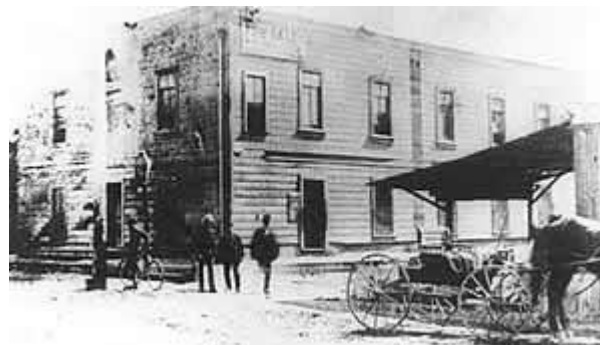
312 Azusa Street (Улица Азуза 312)

Самый же важный автор – это Бог, который сделал эти устные предания, пересказанные сорок лет назад, доступными этому миру в печати. Бог, в Своей величественной силе, сохранил память Тома ясной и точной, не повредив эти истории до мельчайших деталей.