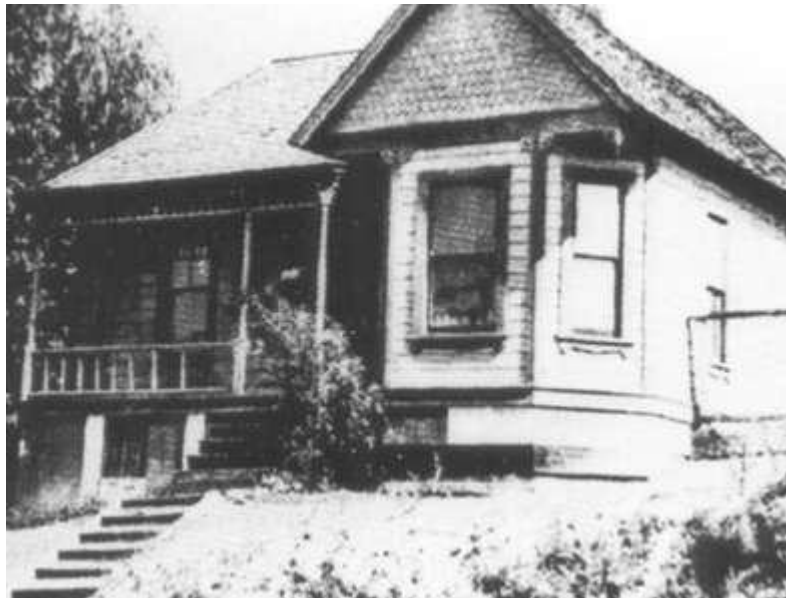
Дом на Bonnie Brae (Бонни Брэй)