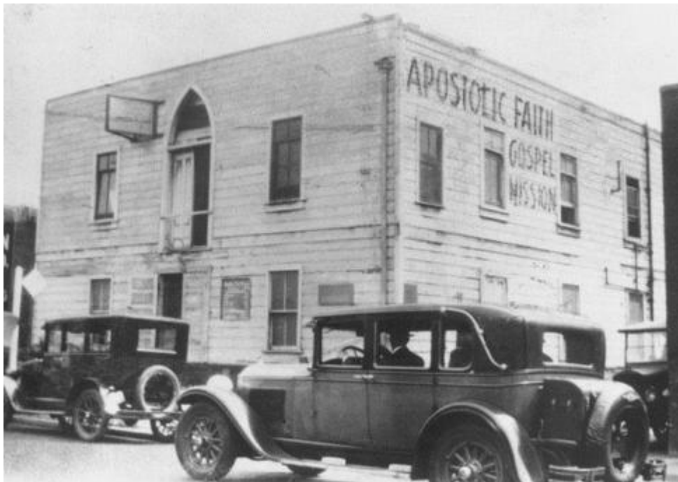
Надпись гласит: Апостольская вера. Миссия Евангелия.